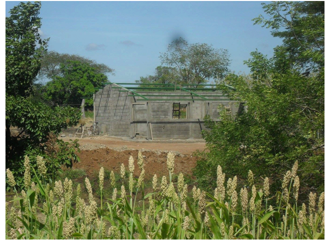
Voortgang Monte Grande

Wij zullen u hier uiteraard van op de hoogte houden via onze volgende nieuwsbrief. Wilt u de meest recente updates over dit project ontvangen? Houd dan onze Facebook en Twitter pagina in de gaten!